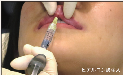
ヒアルロン酸注入