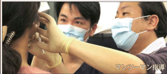
マンツーマン指導

本シリーズ第4期では、矯正歯科・口腔外科機能改善と審美治療としての口唇・鼻唇溝・口角溝・オトガイ唇溝・口腔内・側頭筋下部・表情筋群の基礎解剖と実技、合併症の対応、アートメイク術、歯科における点滴療法の知識を学び、美容歯科としてのスキルを磨きます。歯科自費部門となる美容歯科術(ヒアルロン酸、BOTOX、プラセンタ、口角リフト、ガミースマイル修正と小顔術(顎関節症矯正)・上唇小帯切除術・バツカルファットなど)、点滴療法などアンチエイジング内科、審美のための口唇アートメイク術などの「治療・施術学」を網羅。ライブ供覧に加え、希望者には準マンツーマン指導を行い、タイバンコクでの寄贈検体SoftCadaver使い解剖・治療シミュレーションする歯科解剖ミッションも行います(裏面スケジュール参照)。