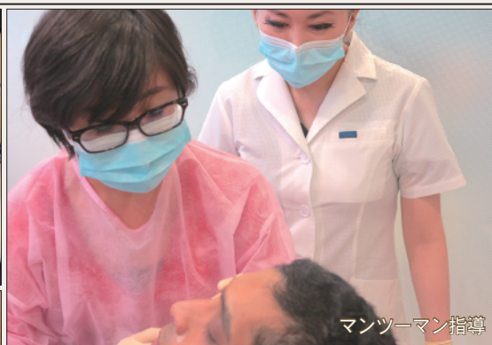
マンツーマン指導